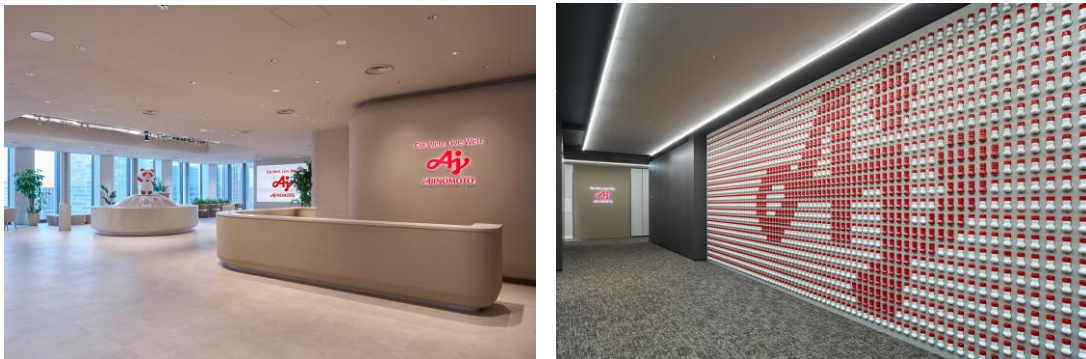
<味の素グループの価値を体感できる空間>

※ZEB(Net Zero Energy Building)を見据えた先進建築物として、外皮の高断熱化及び高効率な省エネルギー設備を備えた建築物(環境省ホームページより)。